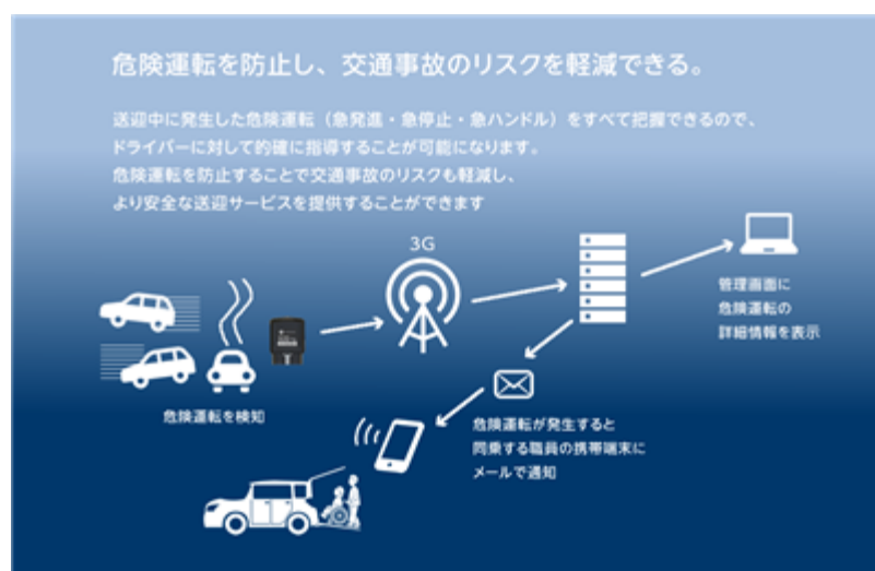
介護送迎専用OBD ソリューションサービス

今後も、介護施設が必要とするサービスの開発と提案を行い、介護事業者の支援を行ってまいります。