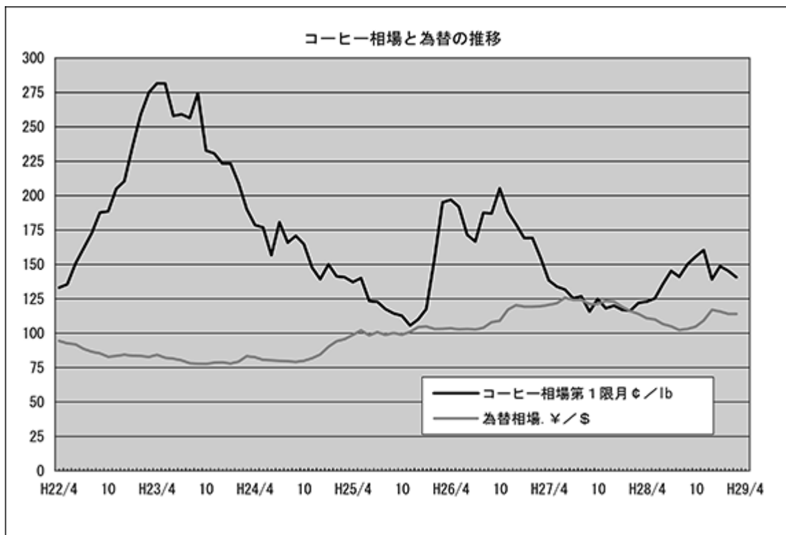
(コーヒー相場：ニューヨークコーヒー先物相場)