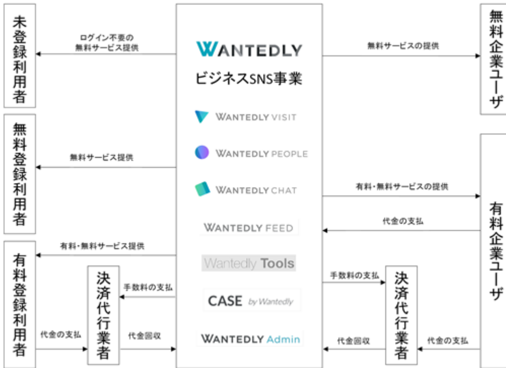
[ 事業系統図 ]