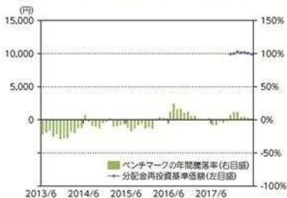
当ファンドの年間騰落率及び 分配金再投資基準価額の推移

*当ファンドの年間騰落率は、税引前の分配金を再投資したものとみなして計算した年間騰落率が記載されますので、実際の基準価額に基づいて計算した年間騰落率とは異なる場合があります。