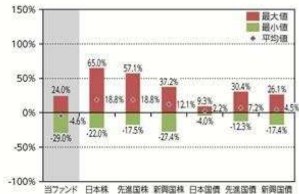
当ファンドと他の代表的な 資産クラスとの騰落率の比較

*2013年6月～2018年5月の5年間の各月末における直近1年間の騰落率の平均・最大・最小を、当ファンド及び他の代表的な資産クラスについて表示し、当ファンドと他の代表的な資産クラスを定量的に比較できるように作成したものです。他の代表的な資産クラス全てが当ファンドの投資対象とは限りません。