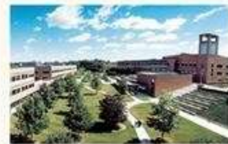
バンガード本社 (ペンシルベニア州バレーフォージ)

(注1) データは2017年12月末現在。ただし、運用資産残高は2018年9月末現在。