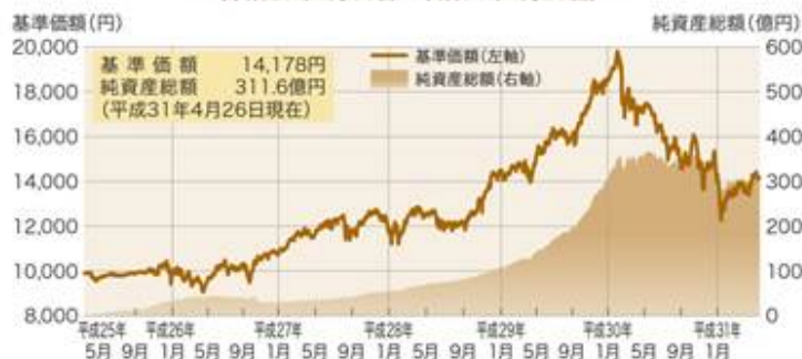
「みのりの投信」の基準価額と純資産総額の推移 (平成25年4月30日～平成31年4月26日)

「みのりの投信」では、お預かりした大切な資産をできるだけ減らさず守りながら着実に増やすという運用方針のもとで、割安な長期成長銘柄を厳選し、規律をもって集中的に投資しています。昨年は世界的な景気減速懸念を受け基準価額は下落しましたが、平成31年に入り上昇傾向にあります。純資産総額は皆様のご支援もありほぼ毎月流入超が続いています。