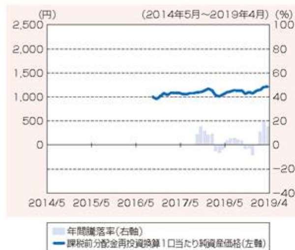
ファンドの年間騰落率および 分配金再投資基準価額の推移