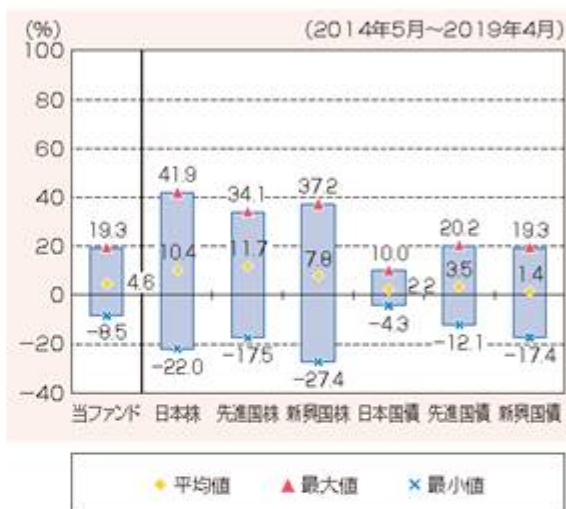
ファンドと他の代表的な資産クラスとの 騰落率の比較

※上記グラフは、上記期間の各月末における直近1年間の騰落率の平均値・最大値・最小値を表示したものであり、ファンドと代表的な資産クラスを定量的に比較できるように作成しています。全ての資産クラスがファンドの投資対象とは限りません。ただし、ファンドは直近1年間の騰落率が5年分ないため、設定日以降算出できる値を使用しています。