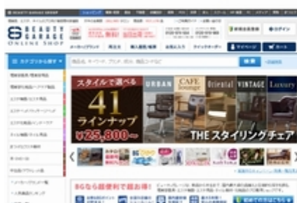
パソコン用サイト