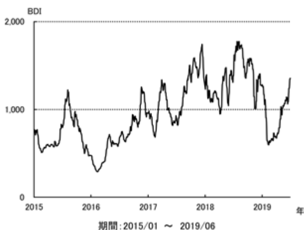
不定期船市況 BDI の推移