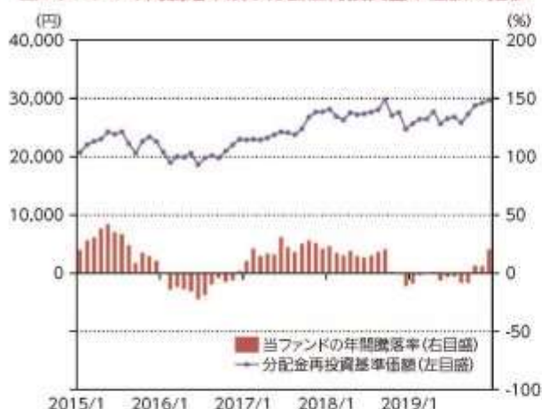
当ファンドの年間騰落率及び分配金再投資基準価額の推移

*当ファンドの年間騰落率は、税引前の分配金を再投資したものとみなして計算した年間騰落率が記載されていますので、実際の基準価額に基づいて計算した年間騰落率とは異なる場合があります。