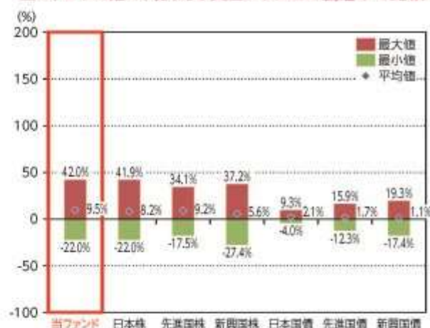
当ファンドと他の代表的な資産クラスとの騰落率の比較

*2015年1月～2019年12月の5年間の各月末における直近1年間の騰落率の平均・最大・最小を、当ファンド及び他の代表的な資産クラスについて表示し、当ファンドと他の代表的な資産クラスを定量的に比較できるように作成したものです。他の代表的な資産クラス全てが当ファンドの投資対象とは限りません。