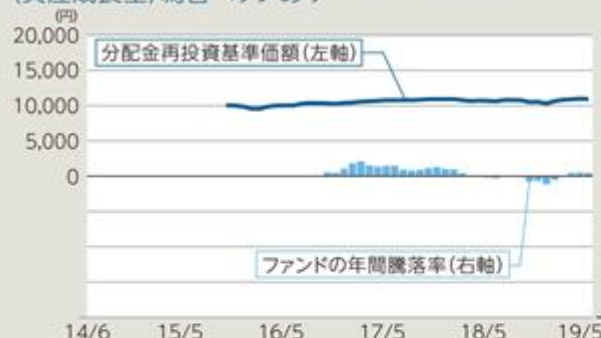
ファンドの年間騰落率及び分配金再投資基準価額の推移 (資産成長型) 為替ヘッジあり