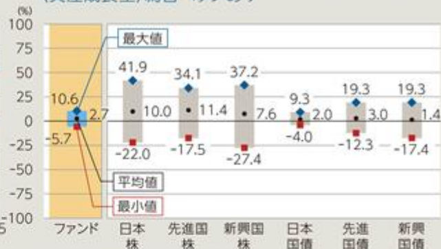
ファンドと他の代表的な資産クラスとの騰落率の比較 (資産成長型) 為替ヘッジあり