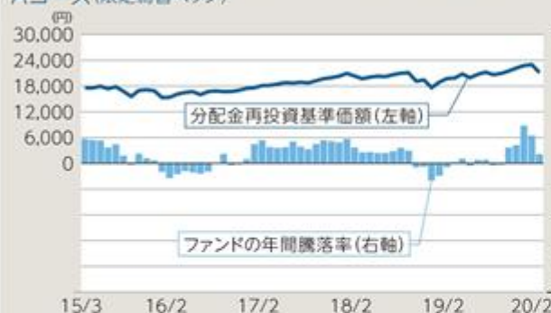
ファンドの年間騰落率及び分配金再投資基準価額の推移 Aコース(限定為替ヘッジ)