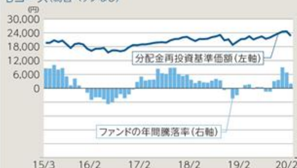
Bコース(為替ヘッジなし)