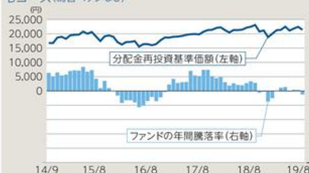
Bコース(為替ヘッジなし)