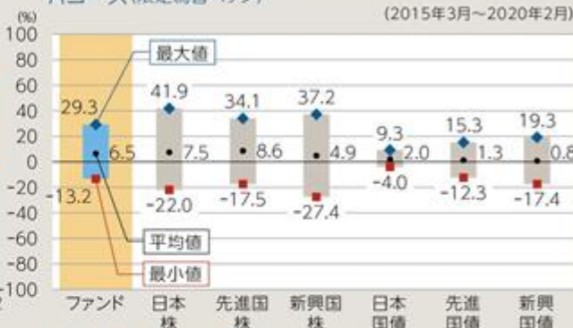
ファンドと他の代表的な資産クラスとの騰落率の比較 Aコース(限定為替ヘッジ)