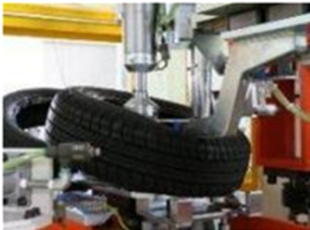
タイヤ組み立て装置