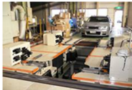
アライメントテスター