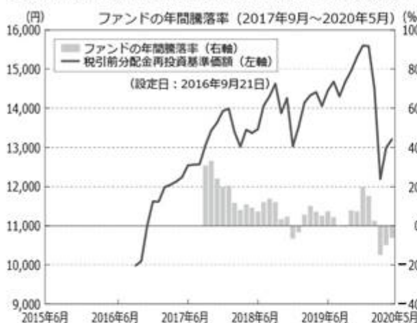
<ファンドの年間騰落率および分配金再投資基準価額の推移>