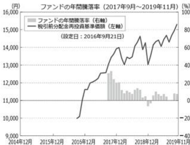
<ファンドの年間騰落率および分配金再投資基準価額の推移>