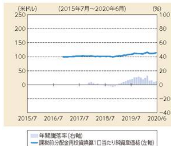
ファンドの年間騰落率および 分配金再投資1口当たり純資産価格の推移