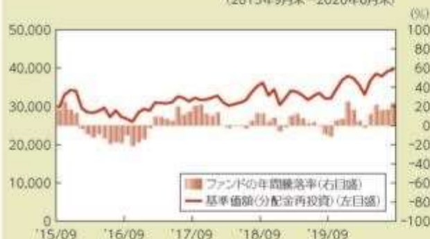
● ファンドの年間騰落率および基準価額(分配金再投資)の推移 (2015年9月末～2020年8月末)