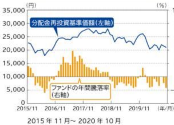
ファンドの年間騰落率及び 分配金再投資基準価額の推移