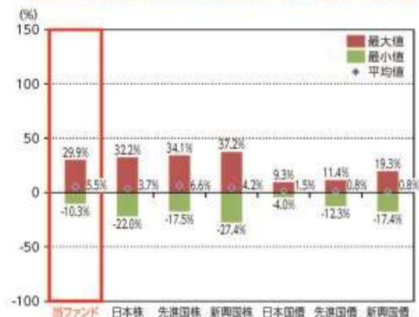
当ファンドと他の代表的な資産クラスとの騰落率の比較