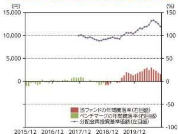
当ファンドの年間騰落率及び分配金再投資基準価額の推移