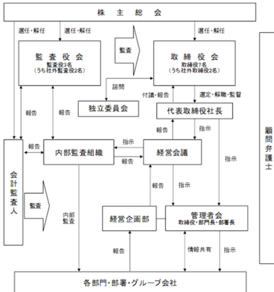
コーポレート・ガバナンス体系図