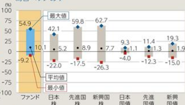
ファンドと他の代表的な資産クラスとの騰落率の比較 為替ヘッジあり