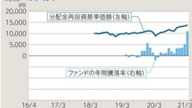
ファンドの年間騰落率及び分配金再投資基準価額の推移 為替ヘッジあり