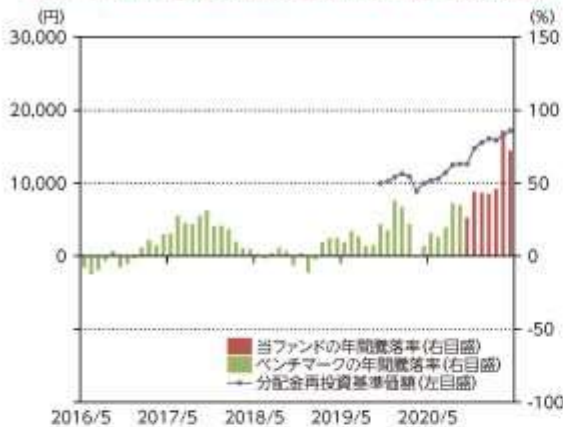
当ファンドの年間騰落率及び分配金再投資基準価額の推移