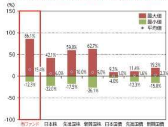
当ファンドと他の代表的な資産クラスとの騰落率の比較