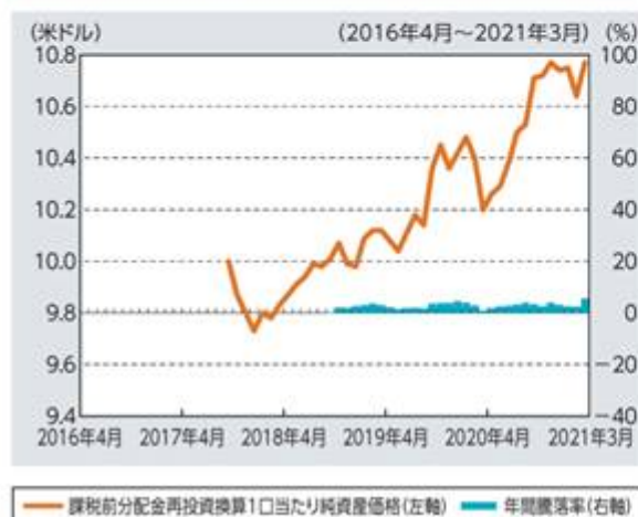
ファンドの年間騰落率および 分配金再投資1口当たり純資産価格の推移

※米ドル(年2回)クラスの年間騰落率は、基準通貨である米ドル建てで計算されています。したがって、円貨に換算した場合、上記とは異なる騰落率となります。