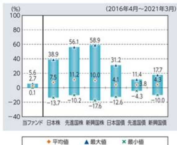
ファンドと他の代表的な資産クラスとの 騰落率の比較

※上記グラフは、上記期間の各月末における直近1年間の騰落率の平均値・最大値・最小値を表示したものであり、ファンドと代表的な資産クラスを定量的に比較できるように作成しています。ただし、ファンドは直近1年間の騰落率が5年分ないため、設定日以降算出できる値を使用しています。すべての資産クラスがファンドの投資対象とは限りません。