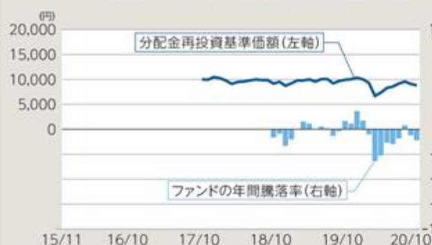
ファンドの年間騰落率及び分配金再投資基準価額の推移