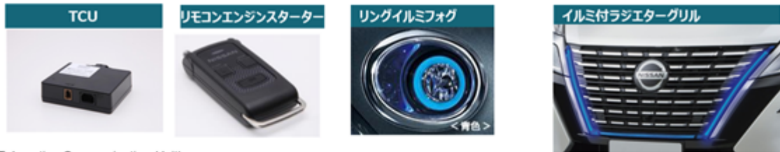
(Telematics Communication Unit)

当社グループでは、自動車純正用品事業において、外装品、電装品等、取り扱っております。