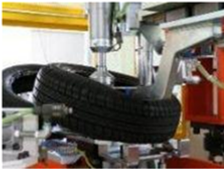
タイヤ組み立て装置