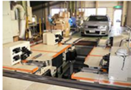
アライメントテスター