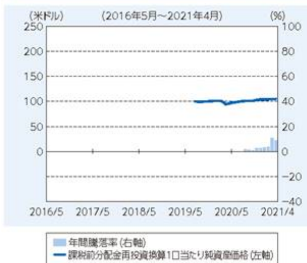
ファンドの年間騰落率および 分配金再投資1口当たり純資産価格の推移