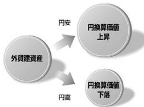
〈為替変動のイメージ図〉