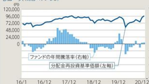
Bコース（為替ヘッジなし）