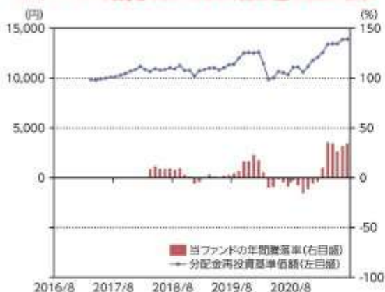
当ファンドの年間騰落率及び分配金再投資基準価額の推移