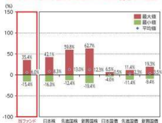
当ファンドと他の代表的な資産クラスとの騰落率の比較