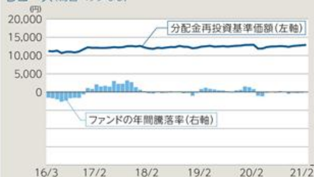
Dコース(為替ヘッジなし)