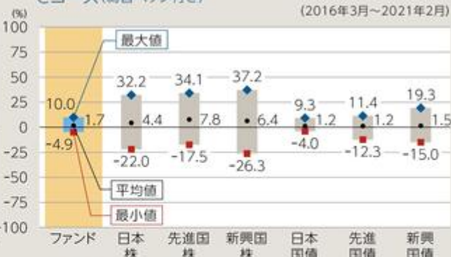
ファンドと他の代表的な資産クラスとの騰落率の比較 Cコース(為替ヘッジ付き)