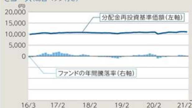
ファンドの年間騰落率及び分配金再投資基準価額の推移 Cコース(為替ヘッジ付き)