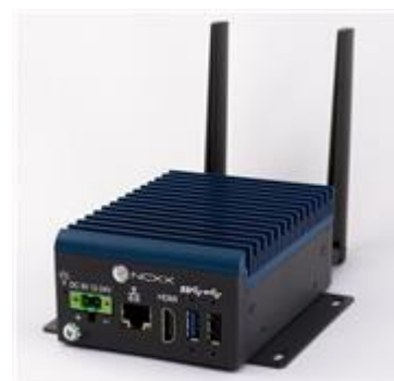
エッジAIコンピュータ「AIX-01NX」