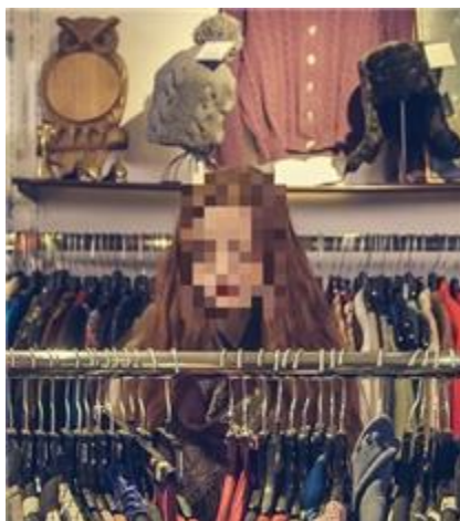
プライバシーに配慮した行動解析

*2「LPWA」とは、「Low Power Wide Area」の略で、「低消費電力で長距離の通信」ができる無線通信技術の総称。