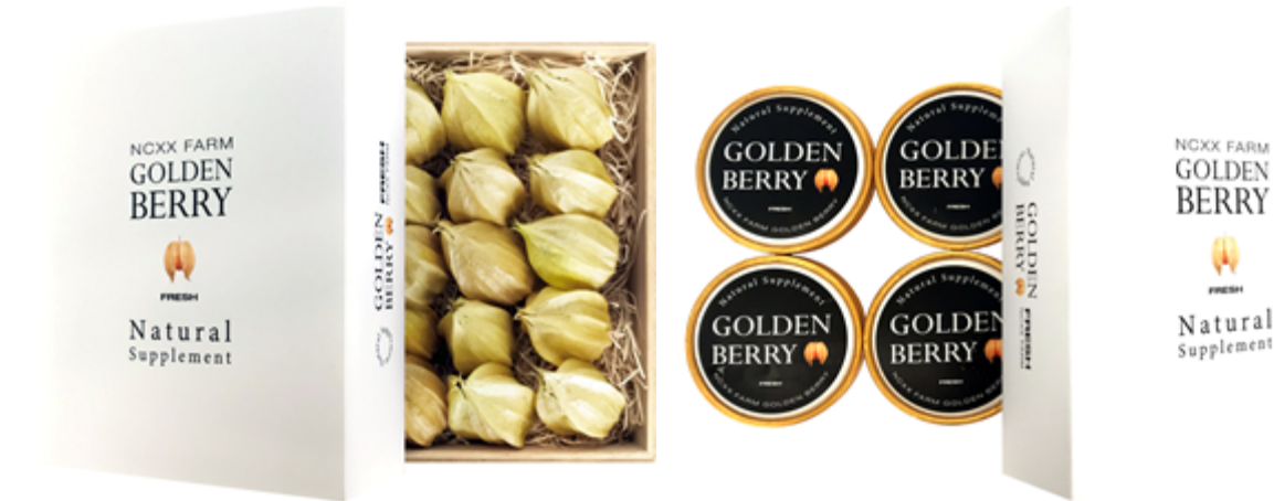
GOLDEN BERRY 桐箱ギフト