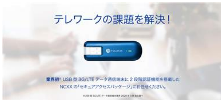
セキュアアクセスパッケージ

また、画像認識などのAI技術をエッジコンピュータ上で用いることでリアルタイムな処理が行え、セキュリティ、プライバシーにも配慮したエッジAI端末「AIX-01NX」の試作機をリリースしました。今後は本格的な販売に向けた試験導入を行ってまいります。