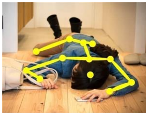
画像認識による姿勢や転倒などの解析

農業ICT事業（NCXX FARM）では、農作物の生産、加工、販売を行う「6次産業化事業」と、特許農法による「化学的土壌マネジメント」+ICTシステムによる「デジタル管理」のパッケージ販売を行う「フランチャイズ事業」の事業化を推進しております。