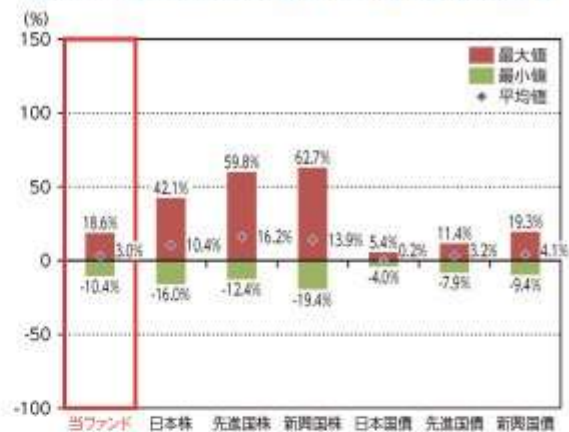
当ファンドと他の代表的な資産クラスとの騰落率の比較

*2016年12月～2021年11月の5年間の各月末における直近1年間の騰落率の平均・最大・最小を、当ファンド及び他の代表的な資産クラスについて表示し、当ファンドと他の代表的な資産クラスを定量的に比較できるように作成したものです。他の代表的な資産クラス全てが当ファンドの投資対象とは限りません。