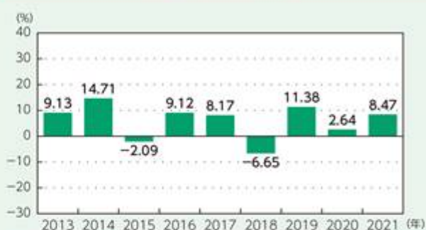
円建 円ヘッジクラス