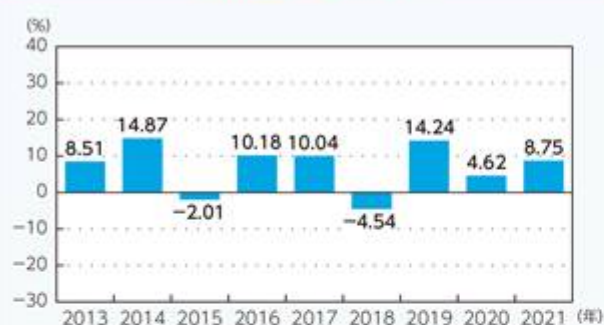
米ドル建 米ドルヘッジクラス