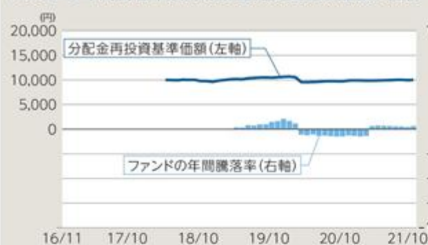
ファンドの年間騰落率及び分配金再投資基準価額の推移