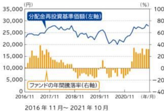
ファンドの年間騰落率及び 分配金再投資基準価額の推移