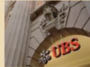
チューリッヒにあるUBSビル(スイス)

(出所)UBSアセット・マネジメントのデータを基に三井住友トラスト・アセットマネジメント作成