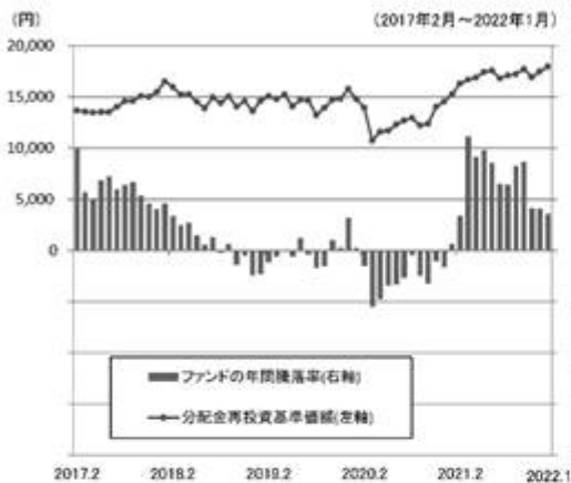
ファンドの年間騰落率と分配金再投資基準価額の推移