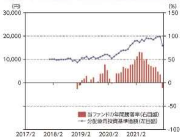
当ファンドの年間騰落率及び分配金再投資基準価額の推移

*当ファンドの年間騰落率は、税引前の分配金を再投資したものとみなして計算した年間騰落率が記載されていますので、実際の基準価額に基づいて計算した年間騰落率とは異なる場合があります。