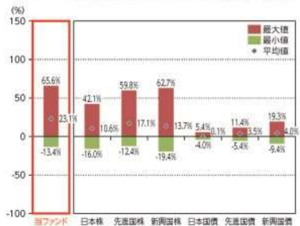
当ファンドと他の代表的な資産クラスとの騰落率の比較

*当ファンドについては2018年12月～2022年1月の3年2ヶ月間、他の代表的な資産クラスについては2017年2月～2022年1月の5年間の各月末における直近1年間の騰落率の平均・最大・最小を表示し、当ファンドと他の代表的な資産クラスを定量的に比較できるように作成したものです。他の代表的な資産クラス全てが当ファンドの投資対象とは限りません。