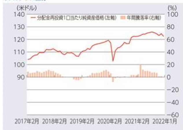
米ドルクラス証券

2017年2月～2022年1月の5年間に於けるファンドの分配金再投資1口当たり純資産価格(各月末時点)と、年間騰落率(各月末時点)の推移を示したものです。