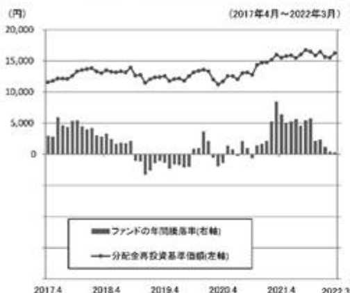
ファンドの年間騰落率と分配金再投資基準価額の推移