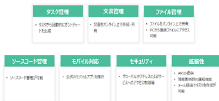
図 プロジェクト管理に必要な基本機能

Backlogは、下図に記載のような契約スペース内で業務ごとにプロジェクトを作成し、特定の職種に限定されずにプロジェクト管理を行うための基本的な機能を提供しております。また、プログラムのソースコードなどを管理するバージョン管理システムを使用しソースコード等をプロジェクトに紐づけて管理することや、モバイルアプリの提供やAPI(注2)の提供をはじめとする拡張性を備えております。さらに、Backlogは契約主体以外の社外メンバーもひとつの契約スペースでプロジェクト進行が可能であり、適切な権限付与により権限管理や情報管理が容易となります。