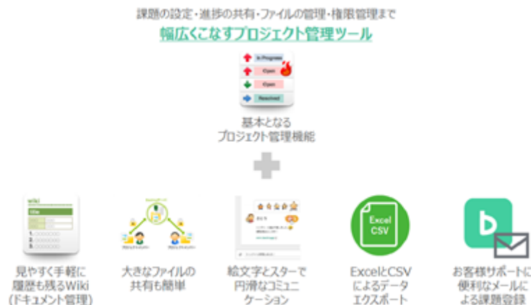
図 コラボレーションを促進するための機能

Backlogは、シンプルでわかりやすいデザインで、開発、デザイン、マーケティング、バックオフィスなど職種を超えたコラボレーションが促進するような様々な機能が付与されており、例えば、プロジェクトや課題に関するメモ、会議の議事録、作業マニュアル、仕様書などチームメンバーに向けた情報を文書で管理できるWiki機能を備えています。その他、プロジェクトメンバーに対する感謝などを伝えることができる絵文字やスター機能、特定のメールアドレスを設定することで自動的にタスクが登録される機能、大容量のファイルの共有、ExcelやCSVによるデータのエクスポート等の機能を備えています。