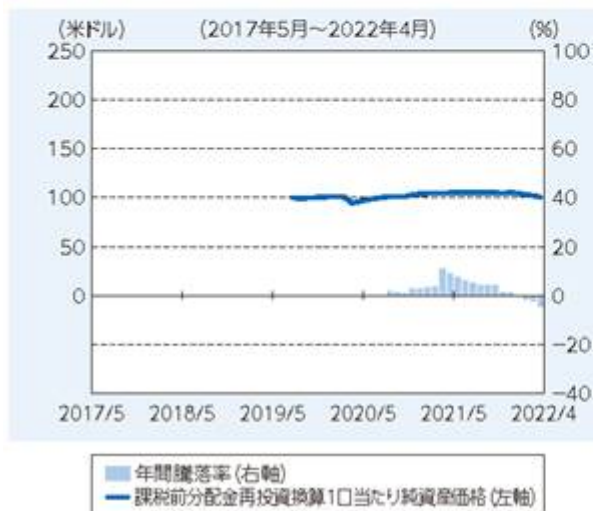
ファンドの年間騰落率および 分配金再投資1口当たり純資産価格の推移

※年間騰落率は、基準通貨である米ドル建てで計算されています。したがって、円貨に換算した場合、上記とは異なる騰落率となります。