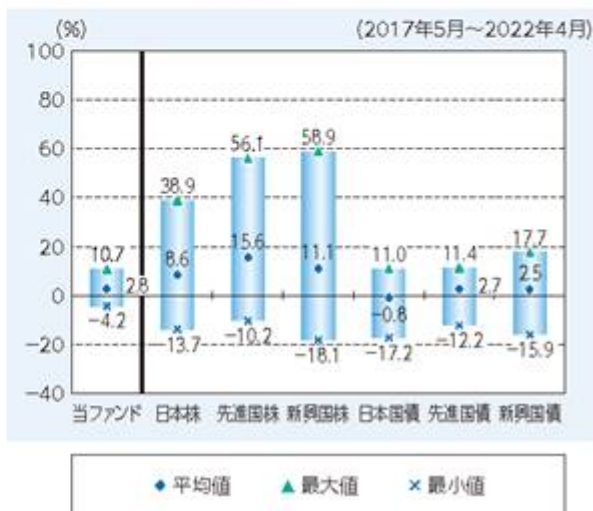
ファンドと他の代表的な資産クラスとの 騰落率の比較

※上記グラフは、上記期間の各月末における直近1年間の騰落率の平均値・最大値・最小値を表示したものであり、ファンドと代表的な資産クラスを定量的に比較できるように作成しています。ただし、ファンドは直近1年間の騰落率が5年分ないため、設定日以降算出できる値を使用しています。全ての資産クラスがファンドの投資対象とは限りません。