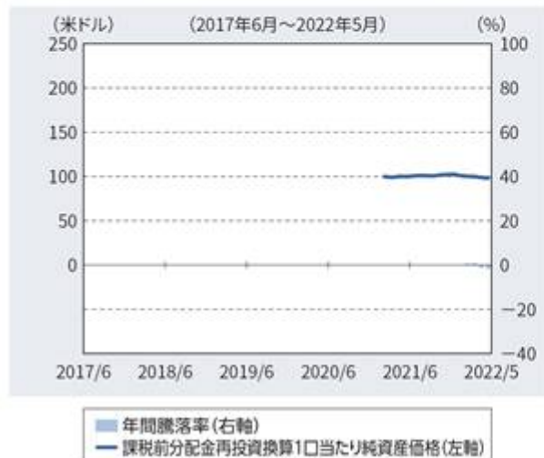
ファンドの年間騰落率および 分配金再投資1口当たり純資産価格の推移