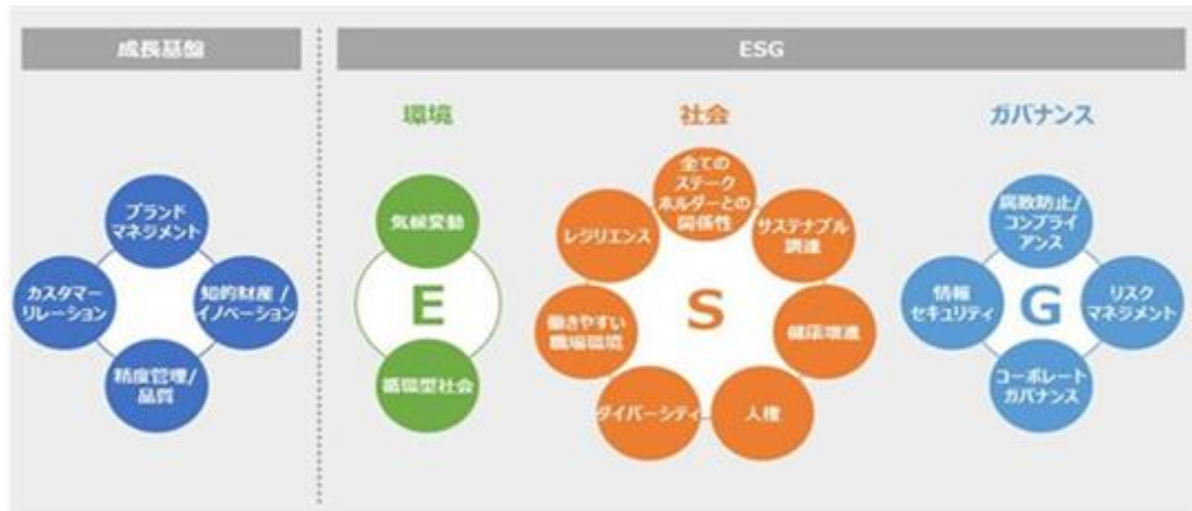
当社グループのマテリアリティ（2021年7月改定）

さらに、当社グループでは、マテリアリティの解決に向けて取り組みを進めるため、2021年3月期から2023年3月期までのサステナビリティ活動に関わるKPIおよび3カ年目標を「サステナビリティ・ロードマップ」として公表しています。