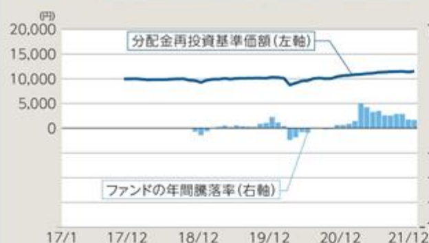
ファンドの年間騰落率及び分配金再投資基準価額の推移