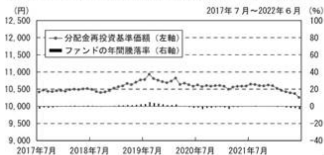
●ファンドの年間騰落率および分配金再投資基準価額の推移

※過去5年間の各月末における分配金再投資基準価額と直近1年間の騰落率を表示したものです。 ※分配金再投資基準価額は、税引前分配金を再投資したものと計算した基準価額であり、実際の基準価額とは異なる場合があります。 ※年間騰落率は、税引前分配金を再投資したものと計算しているため、実際の基準価額に基づいて計算した年間騰落率とは異なる場合があります。