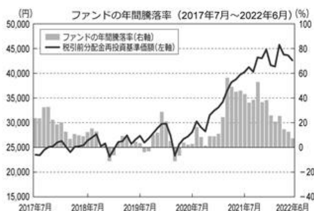
<ファンドの年間騰落率および分配金再投資基準価額の推移>