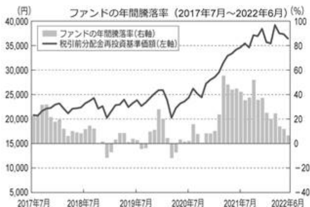
<ファンドの年間騰落率および分配金再投資基準価額の推移>