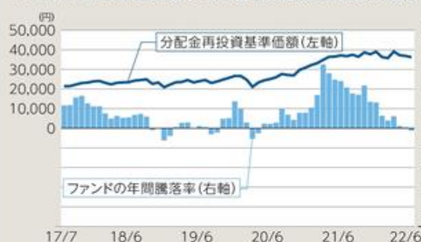
ファンドの年間騰落率及び分配金再投資基準価額の推移