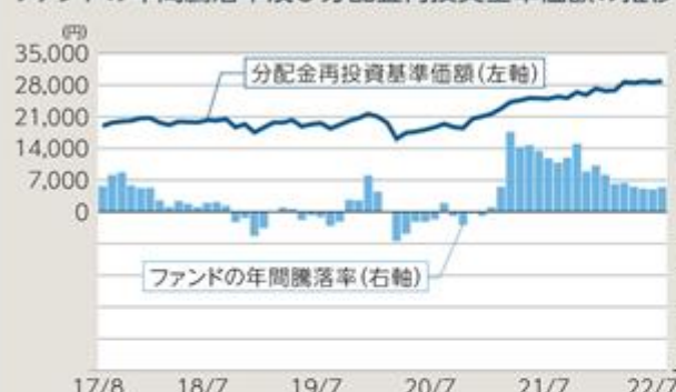
ファンドの年間騰落率及び分配金再投資基準価額の推移