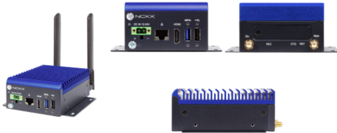
NCXX AI BOX「AIX-01NX」