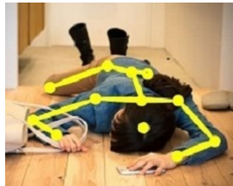
転倒などの異常検知

また、データ通信端末につきましては、これまでのLTE_USB Dongleに変わる主力商品として、第5世代移動通信システムである5Gに対応し、Wi-Fi、Ethernetを搭載したバッテリーレスのルーター・モデムとなる、5Gデータ端末「UNX-05G」を開発しており、2022年中に販売を開始いたします。5Gは、LTEと比べて超高速・大容量な通信で多数同時接続、超低遅を実現するもので、今後、日本全国に基地局の展開が計画されており、ネットワーク上に仮想空間を構築するメタバース関連サービスの通信インフラとしての活用や、ライブメディアストリーミング、エクステンデッドリアリティ(XR)、遠隔医療、建設現場の建機遠隔制御、工場のスマートファクトリ、農業を高度化する自動農場管理、自治体の河川等の監視などの建物内や敷地内でスポット的に柔軟に構築できるローカル5Gへの活用など、地域課題解決や地方創生への対象領域の拡大が期待されます。